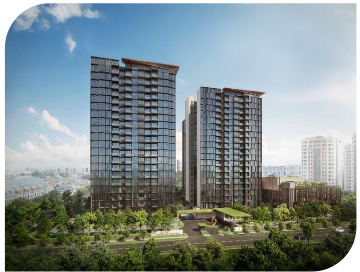
莉丰嘉园 (Tembusu Grand) 项目艺术效果图