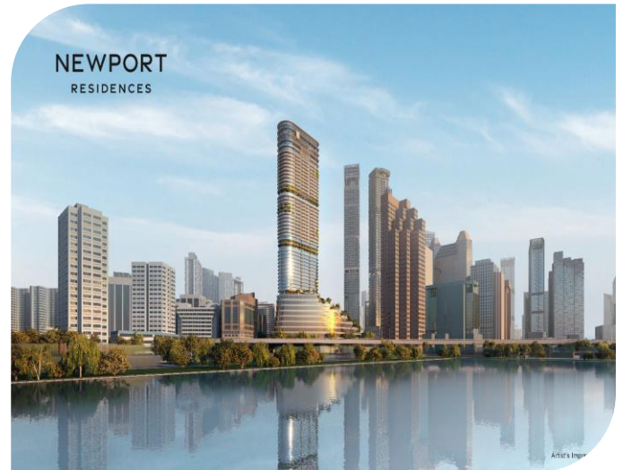
铂海峰 (Newport Residences) 项目艺术效果图