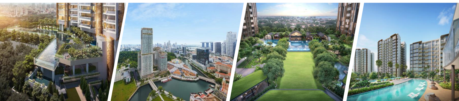
康邻豪庭 (Klimt Cairnhill)、康宁河湾 (Canning Hill Piers)、丽福苑 (Liv@MB) 和万景轩 (The Botany at Dairy Farm) 项目艺术效果图